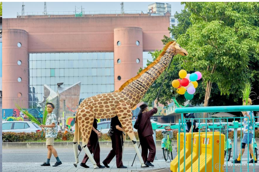
臺南文化中心36週年館慶