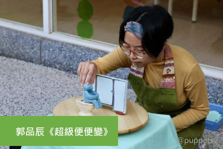
郭品辰《超級便便變》