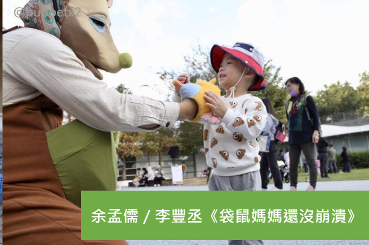
余孟儒 / 李豐丞《袋鼠媽媽還沒崩潰》