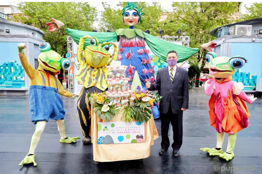
臺南文化中心38週年館慶